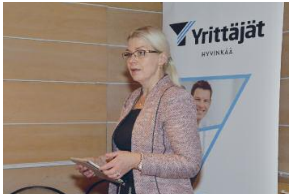
Kansanedustaja Leena Meri kertoi Hyvinkään Yrittäjien syyskokouksessa eduskunnan käsittelyssä olevista syksyn 2016 ajankohtaisista asioista.