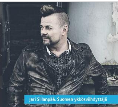
Jari Sillanpää, Suomen ykkösviihdyttäjä

Hyvinkään Yrittäjien bussikuljetus Linjalasta 23.4. kello 15, ilmoittaudu Hyvinkään Yrittäjät toimisto.hy@gmail.com.